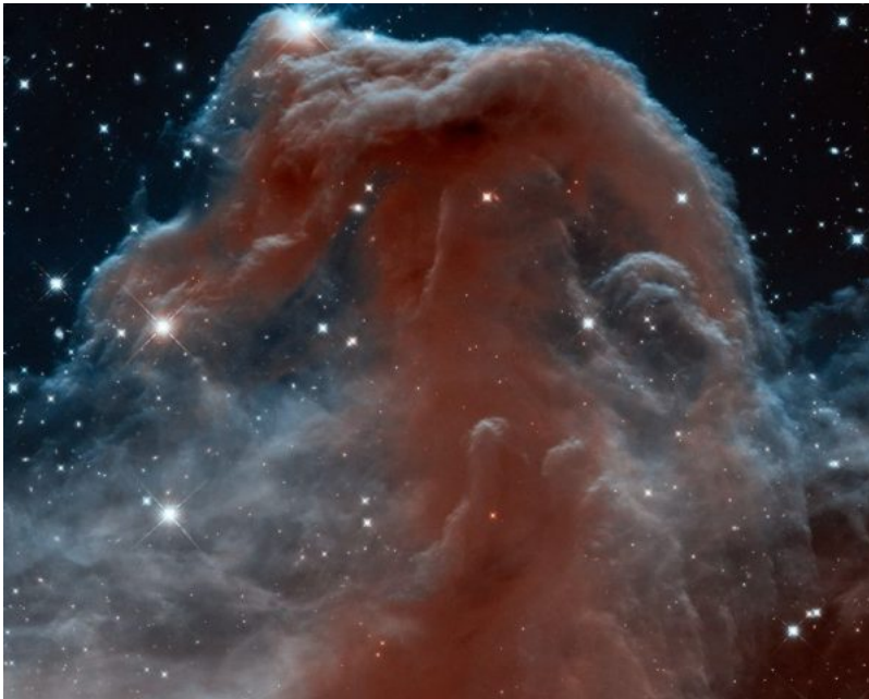
Hubble-infraroodopname van de Paardekopnevel

In het hermetisme is het universum een levend wezen door God voortgebracht.