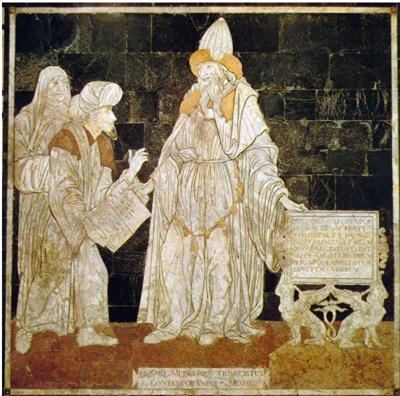
Hermes Trismegistus, vloermozaiek in de kathedraal van Siena

Hermetisme is een religieuze, filosofische en esoterische traditie en is vooral gebaseerd op geschriften van de mythische leraar Hermes Trismegistus. Die geschriften hadden een grote invloed op de westerse esoterie, vooral tijdens de renaissance en de reformatie.