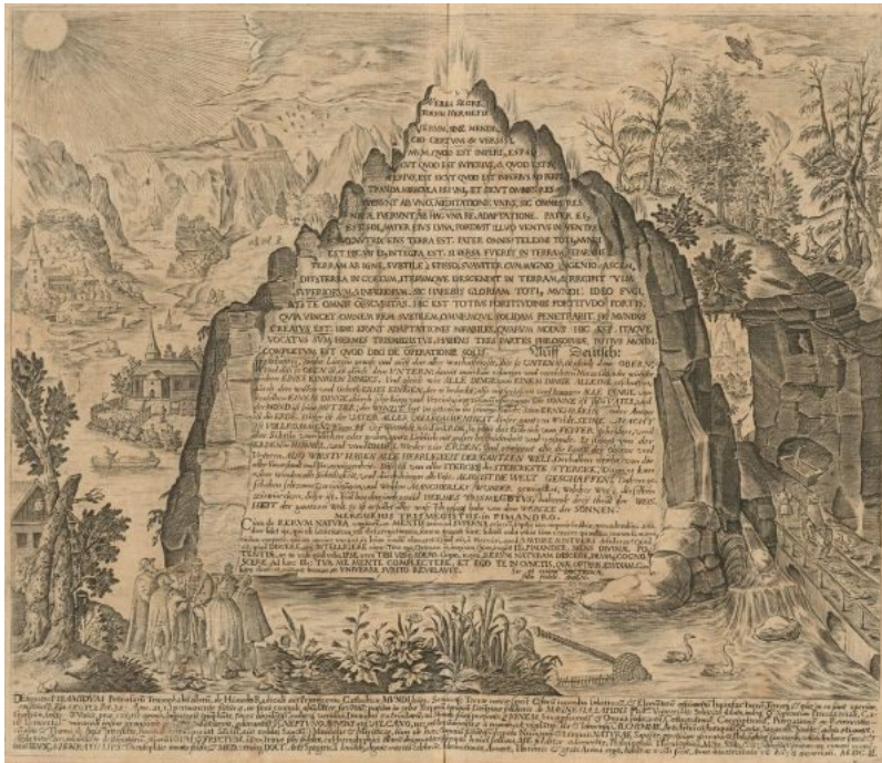
Een 17e-eeuwse afbeelding van de

Smaragden Tafel door Heinrich Khunrath, 1606