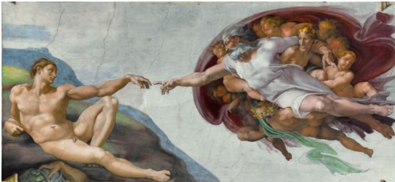
De Scepping van Adam (Michelangelo)

God is transcendent en nooit volledig kenbaar. Hij is niet mannelijk en niet vrouwelijk. Het is een levende god. Andere namen van God zijn: de Verborgene, het Al, het Ene, de Ene, het Goede, de Goede.